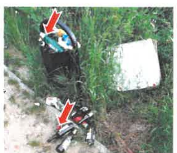
Okolice stawku Morskie Oko (Pułaskiego, Lipowa, Gierymskiego): śmieci, przepełnione kosze, zbyt mało koszy, chwasty przerastające przez ławki.