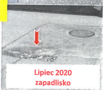
Lipiec 2020 zapadlisko

Kwestia zapadliska w ul. Sienkiewicza zgłaszana była przeze mnie wielokrotnie. Minął rok doraźnych metod i powróciliśmy do sytuacji pierwotnej.