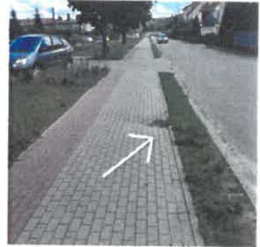
ul. Sportowa na wysokości budynku nr 1, pogłębiające się zapadnięcie chodnika