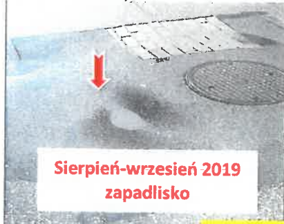
Sierpień-wrzesień 2019 zapadlisko