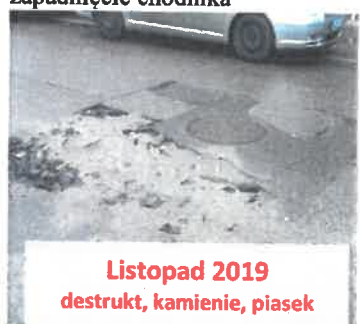
Listopad 2019 destrukcja, kamienie, piasek