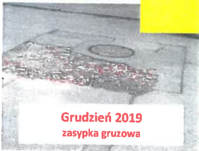
Grudzień 2019 zasyпка gruzowa