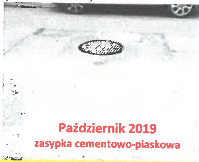
Październik 2019 zasyпка cementowo-piaskowa