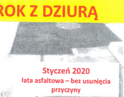
Styczeń 2020 łata asfaltowa – bez usunięcia przyczyny