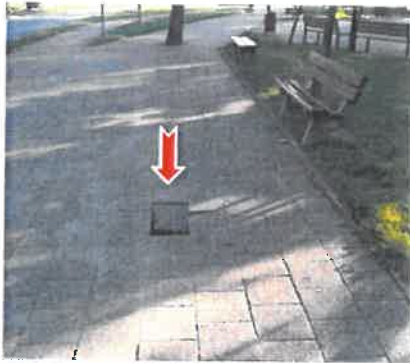
Zapadnięcie chodnika, ul. Woj. Polskiego przy skwerze Orła Białego (stan 22.07.2020)

Dziękując za wcześniejsze działania informuję, że zgłoszono mi poniższe problemy: