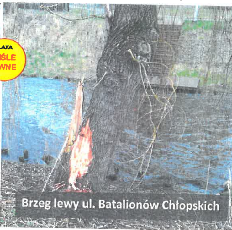
Brzeg lewy ul. Batalionów Chłopskich

Chciałbym się dowiedzieć, kiedy wymieniony problem zostanie rozwiązany?