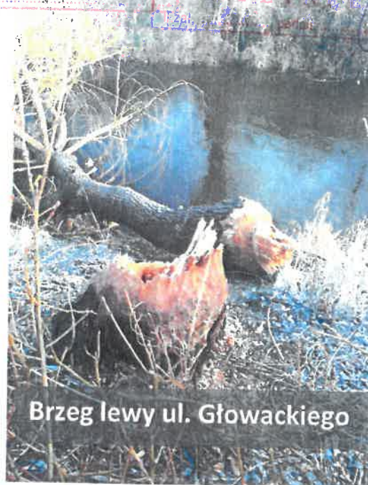
Brzeg lewy ul. Głowackiego

W 2019 r. interpelowałem w sprawie zniszczeń jakie dokonują bobry w drzewostanie umacniającym brzegi rz. Łeby na odcinku śródmiejskim. Informowałem, że prostą metodą zabezpieczenia drzew jest osiatkowanie pnia do wysokości 1,3m. Te drzewa wzmacniają pas brzegowy obciążony zabudową i ciągami komunikacyjnymi. Zapewnił Pan, poinformować mnie o „sposobie zabezpieczenia cennych drzew przed bobrami”, jednak informacji ani konkretnych działań ochronnych nadal nie widać.