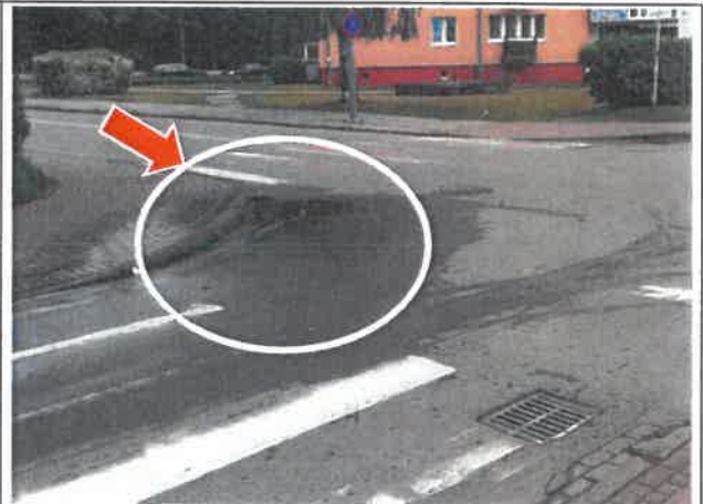
Niedrożna studzienka Legionów Polskich/Mireckiego