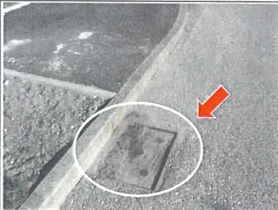
Niedrożna studzienka ul. gen. Maczka/Sucharskiego