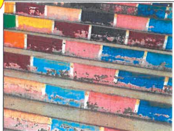
Łuszcząca się nowa elewacja schodów ul. W. Stwosza/Syrokomli

Chciałbym zapytać w jakim terminie zostaną usunięte zgłoszone usterki?