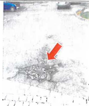
Dziury i degradacja ul. Grottgera

Chciałbym zapytać w jakim terminie zostaną usunięte zgłoszone problemy?