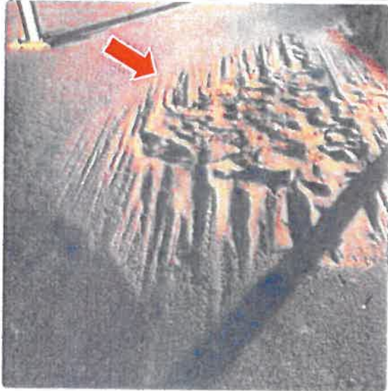
Zapiaszczenie – ścieżka rowerowa ul. Gdańska - przeszkoda dla małoletnich rowerzystów