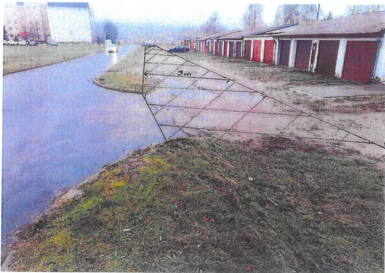
— Teligi fot. 2.jpg