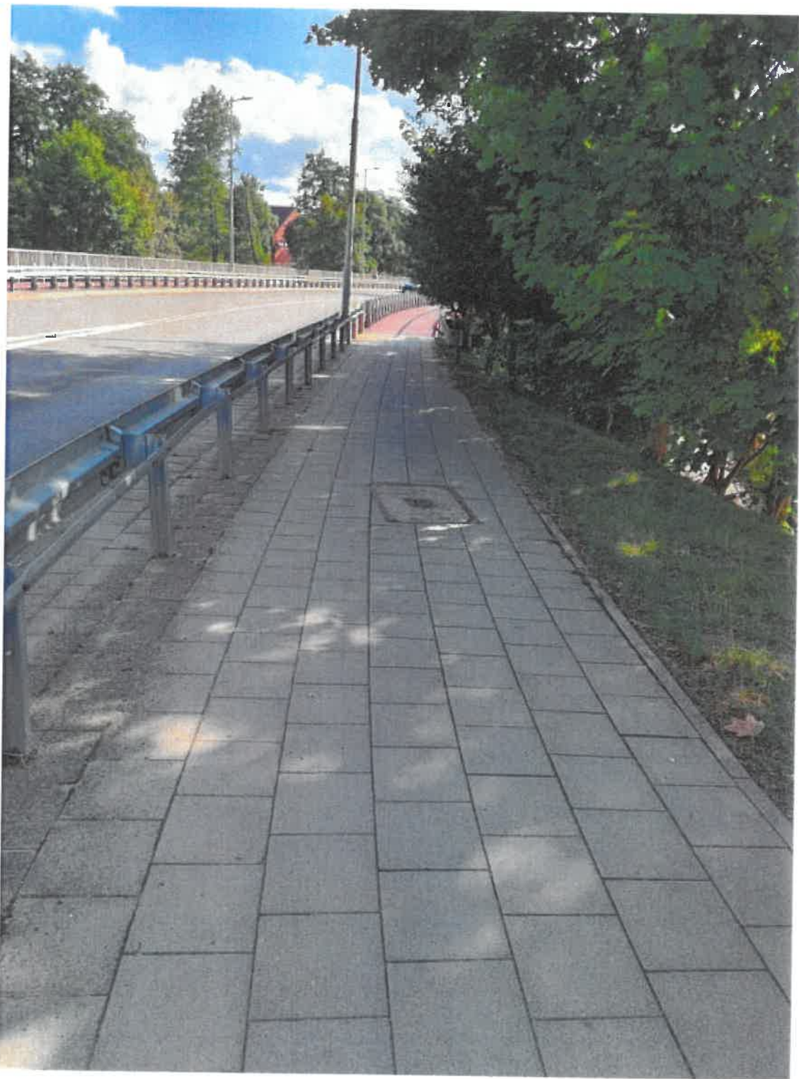
— 13.jpg —