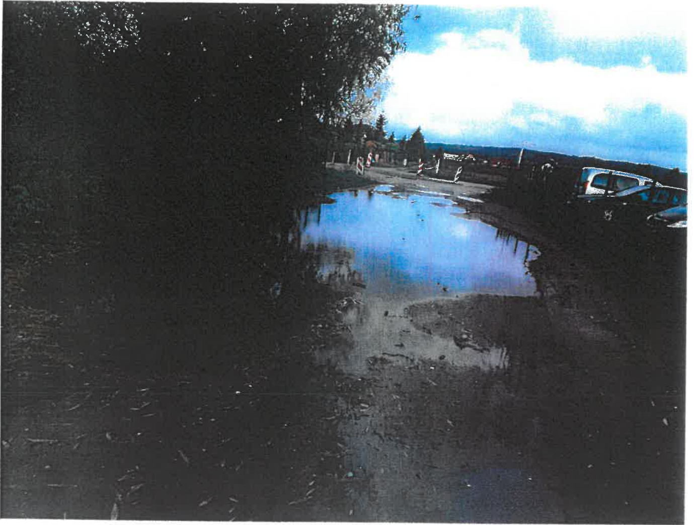
— Portowa 2.png