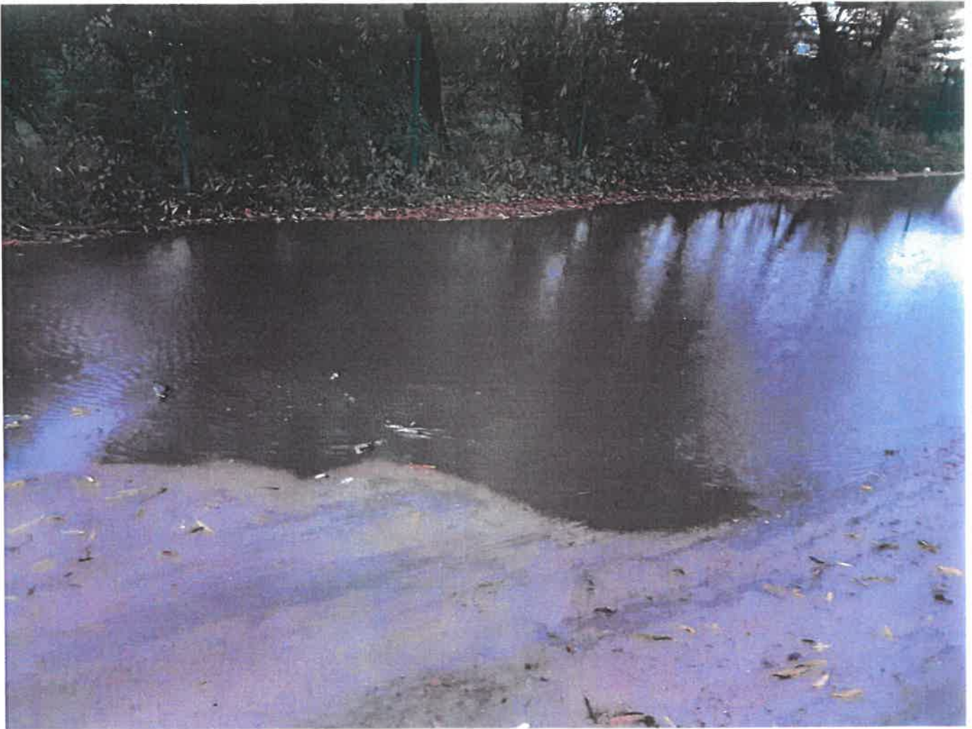
— Portowa 4.png —