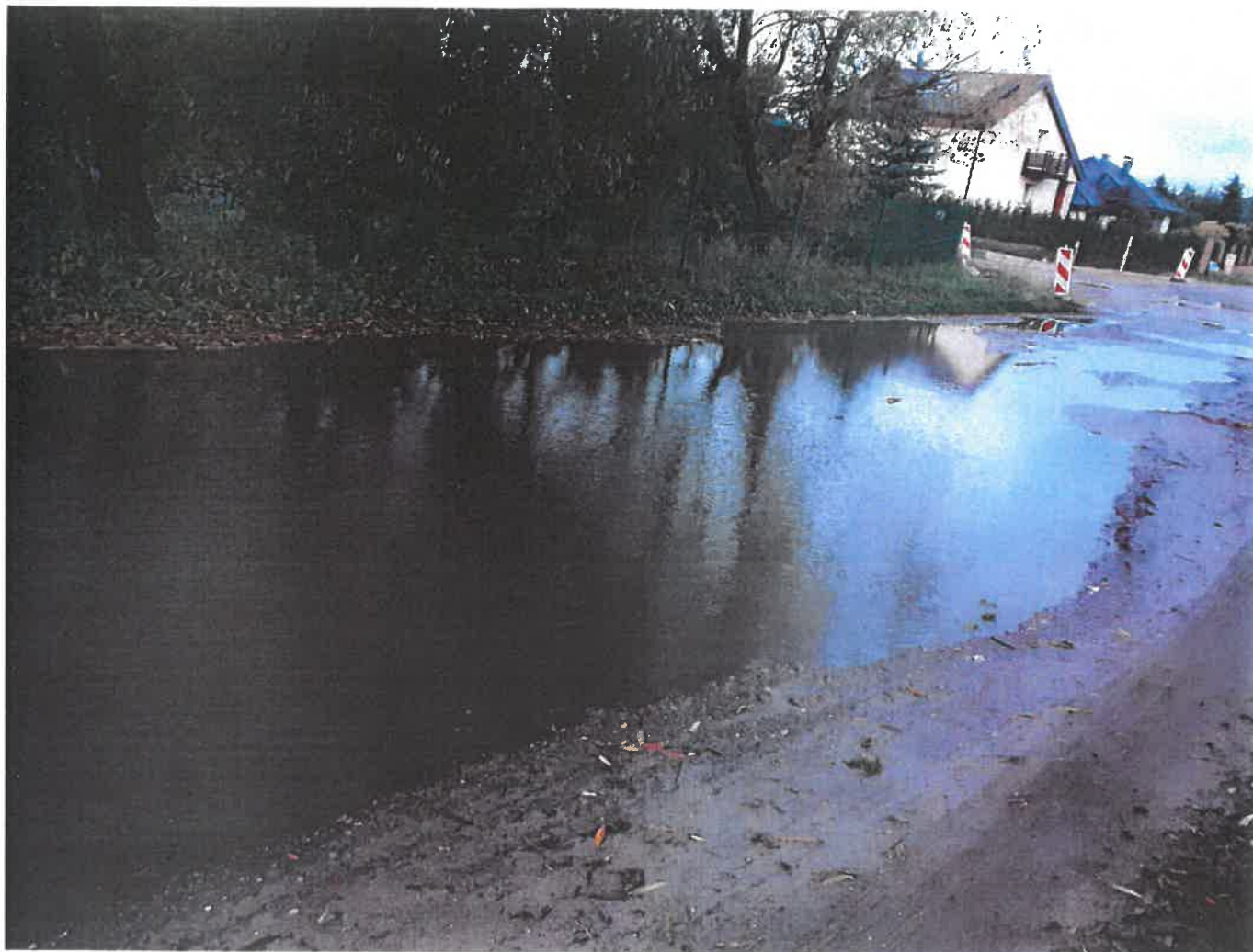
— Portowa 1.png