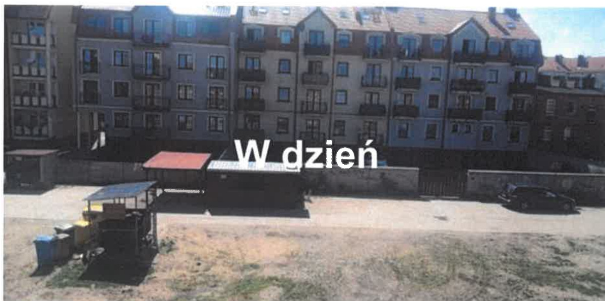
Załącznik graficzny 2