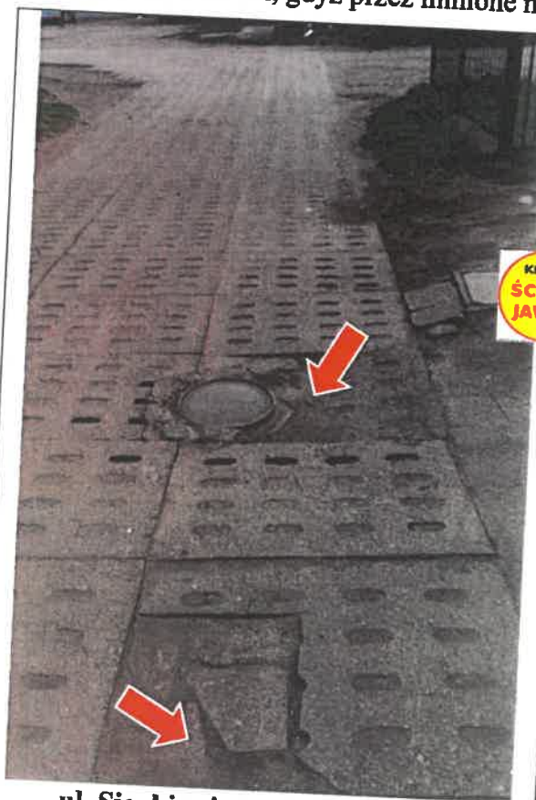
ul. Sienkiewicza 15, utrudnienia dla osoby na wózku inwalidzkim fot. rok 2021

Problem ten zgłaszałem w czerwcu 2021 roku i zgodnie z deklaracją Pana Burmistrza miał być rozwiązany do końca lipca 2021. Niestety po upływie 1,5 roku Pani Bogumiła musiała się przypomnieć ponownie, zgłaszając problem występujący wokół studzienki z o wiele większym nasileniem, gdyż przez minione miesiące degradacja tego rejonu się pogłębiła