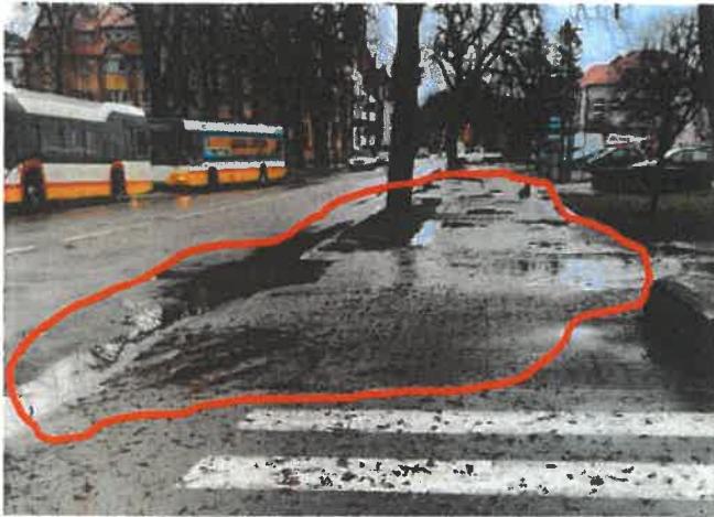
Od wyjazdu z „Mini Parku” do zatoki autobusowej

Jednocześnie na dwuetapowym przejściu dla pieszych pomiędzy Sądem i Przedszkolem Katolickim oraz na sąsiednim przejściu dla pieszych przez ul. Wyszyńskiego, szerokości kałuż uniemożliwia przekroczenie pieszemu tych przejść „suchą nogą”. Skłania to wiele zdesperowanych osób o szukania obejść, co skutkuje sytuacjami ryzykownie niebezpiecznymi. Problem sygnalizowałem już w piśmie z 21.09.2022 – jednakże do tej pory nie został on rozwiązany.