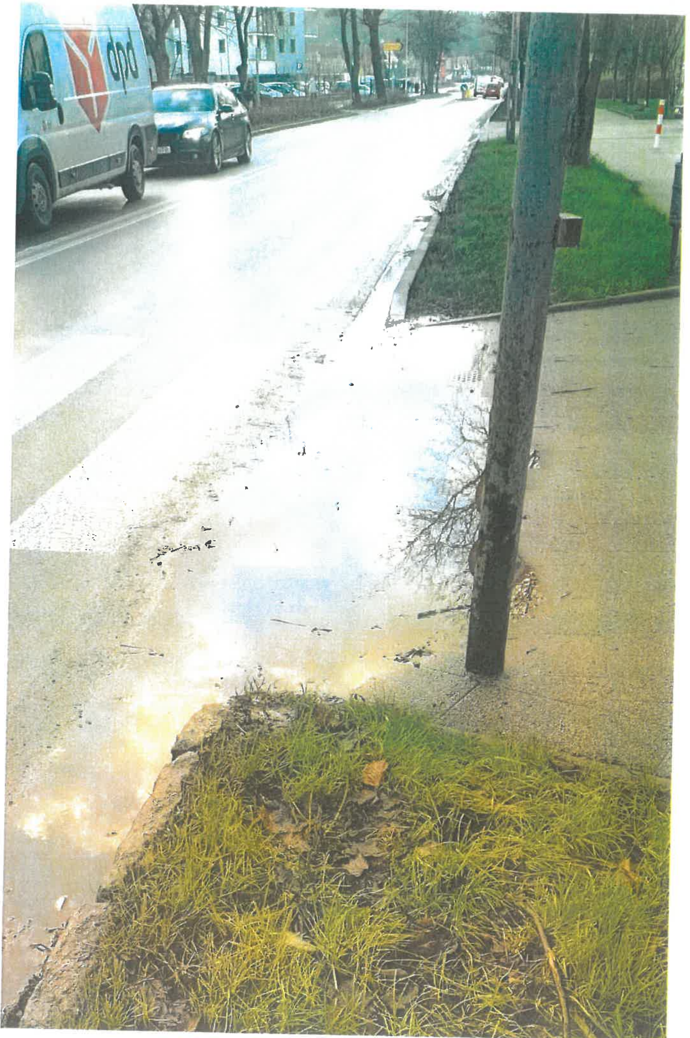
Kałuża na przejściu ze światłami.